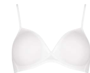
BEHA ZONDER BEUGEL